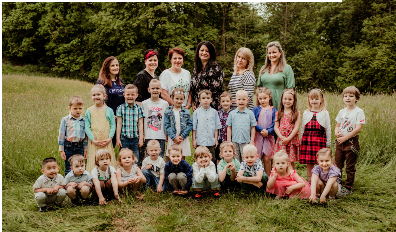
MŠ PETROUPIM 2022/2023

O letních prázdninách bylo ve školce živo. Probíhala zde totiž rekonstrukce druhé třídy za pomoci našich šikovných tatínků, kterým tímto moc děkujeme za skvěle odvedenou práci. Kapacita školky je stále 25 dětí, ale od září 2022 máme dvě třídy – zelenou a modrou. V modré třídě je 13 dětí ve věku 5–6 let a v zelené třídě je 12 dětí ve věku 3–4 roky. Nově se změnil i provoz školky a to od 6.30 do 16.30 hodin. Novou posilou pedagogického týmu se stala paní učitelka Jitka Pšentčíková a paní učitelka Milena Prošková, které se starají o děti v zelené třídě. O děti v modré třídě se i nadále stará paní učitelka Iveta Matušková a paní ředitelka Lucie Papežová. Další posilou je paní Jitka Papežová, která je od září vedoucí školní jídelny a pomocnou kuchařkou a spolu s ní zůstává v kuchyni naše paní kuchařka Eva Knopová. O čistotu a pořádek se v naší školce stará paní Lenka Granátová.