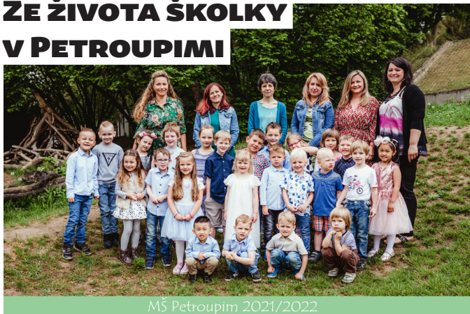
MŠ Petroupim 2021/2022

Školní rok utekl jako voda a na dveře nám pomalu klepou prázdniny. V září jsme začínali v krásném počtu 25 dětí. Pomalu jsme se seznamovali s prostředím školky, našimi třídními pravidly, které nám zpočátku dělaly trochu problém 😊 ale teď už je zvládáme na výbornou. Během školního roku jsme si užili spousty zábavy a dobrodružství. Nechyběly oslavy narozenin, projektové dny, návštěva kina a knihovny či myslivny. A co nás do konce školního roku ještě čeká? Všichni se těšíme na celodenní výlet na Špulku, na ukázkou policejní techniky, která dorazí k nám do školky nebo na představení kouzelníka a v neposlední řadě se moc těšíme na besídku, která nás čeká koncem června.