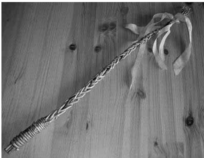
9. dubna - přijďte si ve 14 00 uplést pomlázku do Žiňan

Nastupující jarní období probouzí k aktivitě i členy SDH v Žiňanech. V minulém roce se sbor rozrostl o 4 nové hasiče a hasičky (na celkem již 38 členů) a jejich příchod znamenal i řadu nových podnětů do činnosti našeho spolku. Na prosincové - již 84. - výroční valné hromadě jsme schválili poměrně ambiciózní plán činnosti sboru a nyní již pomalu přichází období naplňování tohoto plánu. Po březnovém Masopustním průvodu, který jsme uspořádali s hasiči z Mezihoří, nás čeká celkem pestrý duben. Hned 2. dubna pořádáme od 9 00 brigádu, kdy se budeme věnovat jednak úklidu veřejných míst a zahájíme práce na řadě úprav a vylepšení žiňanské hasičské zbrojnice. Následující sobotu - 9. dubna - připravili naše členky velikonoční odpolední program pro děti z celé obce a okolí - začátek je v 14 00 hodin v obecním domku v Žiňanech - kdo přijde, naučí se jak uplést pomlázku, otloukat píšťaličku anebo si namaluje vlastní kraslici. A třetí dubnovou sobotu chystáme ve spolupráci s dobrovolnými záchranáři Life Rescue, o. s. odpolední Kurz první pomoci a večer pak členskou schůzi. Poslední dubnovou sobotu nás čeká tradiční pálení čarodějnic a noční stráž u májky (nebo preventivní kontrola požárního zabezpečení májky v okolí - kdo ví?:))