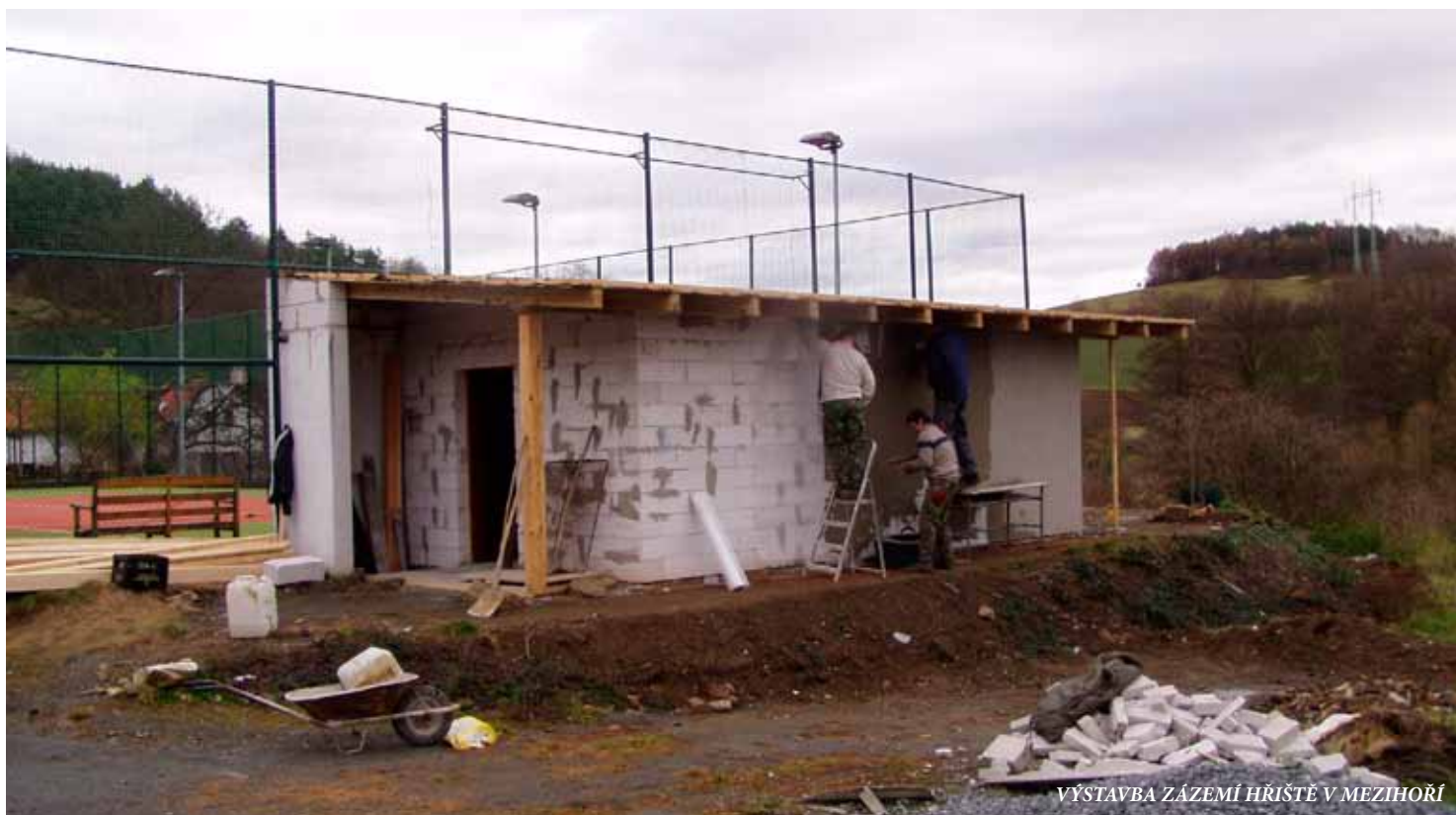
VÝSTAVBA ZÁZEMÍ HŘIŠTĚ V MEZİHOŘÍ