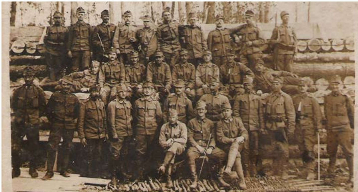
Posádka v přední linii na východní frontě.